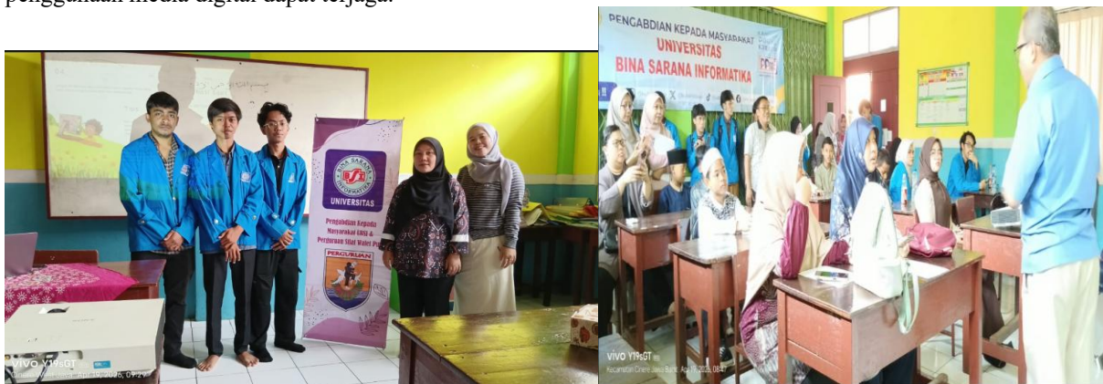
Gambar 2. Penyampaian Materi Pengabdian Kepada Mitra Dengan Pendampingan Mahasiswa

Selain itu, kegiatan pelatihan yang dilakukan kepada anggota dan pengelola perguruan pada Gambar 2 menunjukkan adanya peningkatan pemahaman dan keterampilan dalam memanfaatkan teknologi digital. Peserta pelatihan mampu membuat dan mengelola konten website secara mandiri, sehingga diharapkan keberlanjutan penggunaan media digital dapat terjaga.