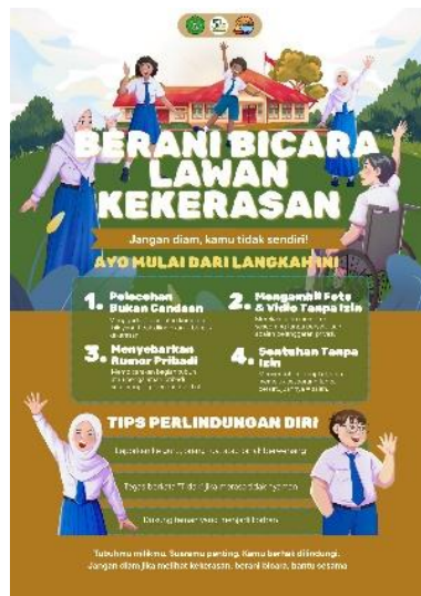
Gambar 6. Poster Edukasi Lawan Kekerasan Seksual

Poster edukatif ditempatkan di area strategis sekolah dengan pesan singkat seperti “Tubuhmu bukan milik siapa pun” dan “Berani Bicara, Itu Tanda Kuat.” Media visual ini tidak hanya memperkuat daya ingat siswa tetapi juga menjadi pengingat jangka panjang di lingkungan sekolah. Guru dan pihak sekolah menyambut baik kegiatan ini karena isu kekerasan seksual dinilai penting namun jarang dibahas secara terbuka.