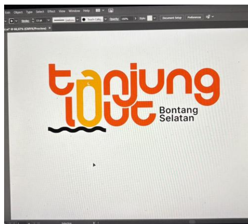
Gambar 8. Pembuatan Logo Kelurahan Tanjung Laut

Pembuatan logo Kelurahan Tanjung Laut telah menghasilkan sebuah identitas visual resmi yang dapat dimanfaatkan dalam berbagai kebutuhan, seperti surat-menyurat, banner, media sosial, maupun publikasi resmi lainnya. Logo ini dirancang dengan memperhatikan prinsip visual branding, yaitu menghadirkan simbol yang mampu merepresentasikan karakter wilayah sekaligus nilai-nilai lokal masyarakat.