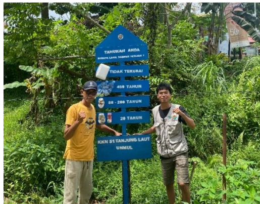
Gambar 7. Pemasangan Plang Edukasi Sampah

kesadaran bahwa sampah organik lebih ramah lingkungan karena bisa terurai lebih cepat dan diolah kembali menjadi kompos. Dengan demikian, media sederhana berupa plang terbukti mampu menjadi sarana edukatif yang mendorong perubahan perilaku masyarakat menuju gaya hidup yang lebih peduli lingkungan.