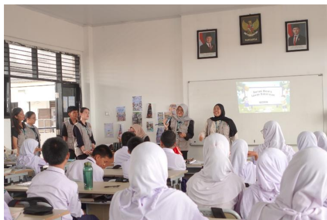
Gambar 5. Dokumentasi Sosialisasi Kekerasan Seksual di SMPN 2 Bontang

Penyampaian dilakukan dengan pendekatan interaktif, menggunakan bantuan media visual seperti slide presentasi, poster edukasi, dan sesi tanya jawab. Pelaksanaan kegiatan melibatkan guru pendamping dan BK sekolah, serta partisipasi aktif dari siswa kelas VIII.