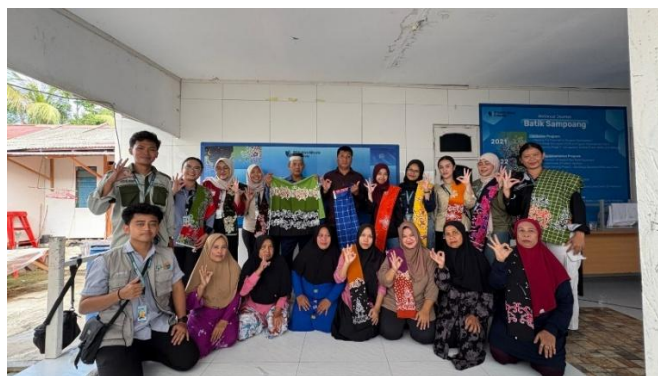
Gambar 3. Sosialisasi Manajemen waktu produksi dan digitalisasi marketing

Selain itu, program ini juga menekankan pentingnya branding berbasis kearifan lokal sebagai identitas budaya. Batik Sampoang dengan motif pesisirnya tidak hanya berfungsi sebagai produk ekonomi, tetapi juga sebagai sarana diplomasi budaya dan pemberdayaan perempuan pesisir. Meskipun masih menghadapi keterbatasan kapasitas produksi, promosi, dan popularitas di tingkat lokal, partisipasi dalam pameran nasional serta transformasi digital memberikan peluang besar untuk meningkatkan daya saing. Dengan demikian, integrasi antara efisiensi internal melalui manajemen produksi dan ekspansi eksternal melalui digitalisasi pemasaran menjadi fondasi penting dalam membangun UMKM yang berdaya saing, berkelanjutan, sekaligus memperkuat identitas budaya masyarakat pesisir Tanjung Laut.