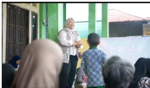
Gambar 2. Sosialisasi PHBS dan Sanitasi Lingkungan

Berdasarkan hasil wawancara dengan Kepala Puskesmas Kelurahan Tanjung Laut, diketahui bahwa angka stunting di wilayah tersebut masih cukup tinggi dan menjadi fokus utama pelayanan kesehatan masyarakat. Tantangan penanggulangan stunting di Kota Bontang tidak hanya disebabkan oleh kurangnya asupan gizi, tetapi juga dipengaruhi oleh faktor sosial dan psikologis dalam keluarga. Kepala Puskesmas menjelaskan bahwa sebagian besar kasus stunting ditemukan pada keluarga dengan tingkat pendidikan rendah, kondisi ekonomi rentan, serta minimnya pengetahuan mengenai praktik pemberian makanan bayi dan balita yang tepat. Selain itu, faktor kebersihan dan sanitasi lingkungan keluarga yang belum memadai turut menjadi penyumbang tingginya angka stunting, terlebih wilayah Tanjung Laut yang merupakan kawasan pesisir dengan kerentanan lingkungan yang cukup tinggi.