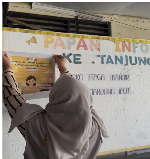
Gambar 9. Pemasangan Poster di Kelurahan Tanjung Laut

Secara keseluruhan, program ini menunjukkan bahwa pendekatan visual sederhana dapat menjadi intervensi murah, praktis, dan efektif untuk meningkatkan pemahaman serta membangun budaya pelayanan publik yang transparan dan akuntabel di Kelurahan Tanjung Laut.