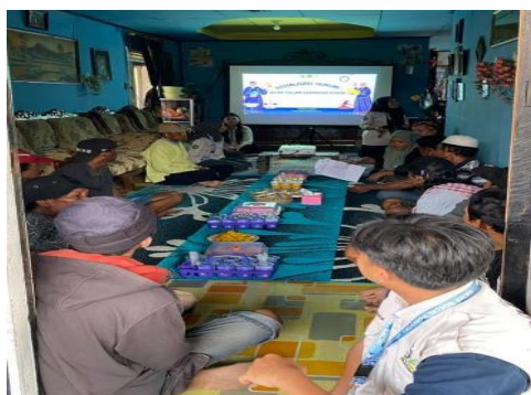
Gambar 6. Sosialisasi Hukum : Bijak Dalam Bersosial Media

Pelaksanaan sosialisasi hukum bertema Bijak dalam Bermedia Sosial di Pulau Taduttan, Desa Saliki, Kecamatan Muara Badak, berjalan dengan hasil positif ditandai antusiasme tinggi anggota KTH Maccini Baji Taduttan yang hadir tepat waktu, menyimak materi dengan serius, serta aktif berdiskusi. Materi mengenai dasar hukum penggunaan media sosial, khususnya UU ITE, membuka wawasan peserta bahwa tindakan sederhana seperti menyebarkan informasi tanpa verifikasi atau menuliskan komentar bernada kebencian dapat menimbulkan konsekuensi hukum, sehingga menumbuhkan kesadaran bahwa media sosial adalah ruang publik yang perlu dijalankan dengan tanggung jawab. Diskusi interaktif memperkuat pemahaman karena peserta dapat mengaitkan materi dengan pengalaman nyata, seperti hoaks di grup WhatsApp atau pencemaran nama baik, sekaligus memperoleh penjelasan tentang langkah praktis menghadapi persoalan hukum digital. Kegiatan ditutup dengan pembagian leaflet edukasi dan hadiah sederhana yang menambah semangat kebersamaan, sehingga sosialisasi ini tidak hanya berhasil mentransfer pengetahuan, tetapi juga menumbuhkan budaya digital yang sehat di kalangan anggota KTH sekaligus memperkuat peran mereka sebagai teladan dalam masyarakat Desa Saliki.