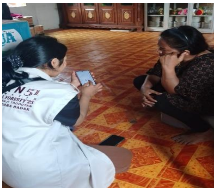
Gambar 4 : Pendaftaran UMKM ke Google Maps

perkembangan UMKM antara lain, Direction, Share Place, dan Review yang bisa disertai dengan gambar. Sasaran dari kegiatan ini adalah UMKM dan Tempat Umum yang sekiranya memiliki potensi yang bagus untuk dikembangkan dan dipasarkan melalui media online. UMKM yang terpilih adalah Chacollection_Bouquetbykeii, Toko Eka Kharisma, Toko Rahima, Toko Saharini, Toko Zea, Toko Poronogo, Toko Raisa, Toko Rara.