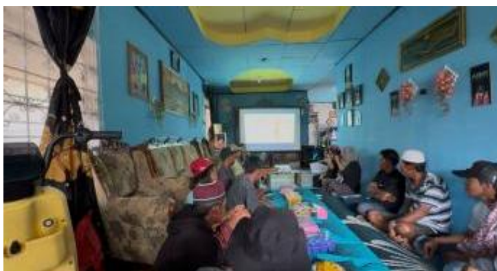
Gambar 2: Pelaksanaan Sosialisasi dan Pembahasan AD/ART

Pelaksanaan sosialisasi dan pendampingan hukum perdata kepada Kelompok Tani Hutan (KTH) Maccini Baji Taddutan berhasil memberikan pemahaman normatif mengenai aturan dasar kelembagaan dengan mengedepankan prinsip partisipatif melalui diskusi, tanya jawab, dan simulasi penyusunan dokumen organisasi. Kegiatan ini menitikberatkan pada aspek hukum perdata terkait penyusunan AD/ART, pencatatan keuangan sederhana, serta mekanisme pengambilan keputusan yang sah sesuai Pasal 1338 KUHPer dan UU No. 17 Tahun 2013 tentang Organisasi Kemasyarakatan. Hasilnya menunjukkan peningkatan pemahaman anggota terhadap hak, kewajiban, legalitas organisasi, serta kesadaran hukum ( rechtsbewustzijn ) yang lebih baik, ditunjukkan dengan antusiasme peserta dalam membahas perjanjian, penyelesaian sengketa internal, dan tata kelola keuangan. Pendampingan yang disertai praktik penyusunan AD/ART dan administrasi kelembagaan membuat pengetahuan yang diperoleh bersifat aplikatif dan mendukung prinsip kepastian hukum ( rechtszekerheid ), sehingga memperkuat legalitas, keteraturan, akuntabilitas, serta kedudukan hukum KTH, sekaligus menjadi langkah preventif untuk meminimalisir potensi sengketa di masa depan.