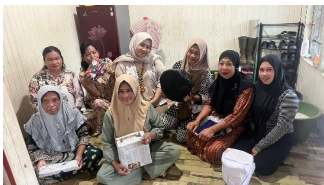
Gambar 5 : Pelaksanaan Workshop Kewirausahaan Sabun Cuci Piring Ramah Lingkungan

Program pengabdian masyarakat di Pulau Taddutan bertujuan untuk memberdayakan ibu rumah tangga secara ekonomi dan meningkatkan kesadaran lingkungan. Program ini berfokus pada dua kegiatan utama: lokakarya pembuatan sabun cuci piring ramah lingkungan dan pembentukan kelompok usaha. Sebanyak 10 ibu rumah tangga dilatih baik secara teori maupun praktik. 95% peserta memahami konsep kewirausahaan, dan 100% berhasil membuat prototipe sabun berkualitas. Sebagai tindak lanjut, koperasi "Cahaya Berkah" didirikan dengan 12 anggota aktif. Kelompok ini telah mengembangkan rencana produksi dan pemasaran, menunjukkan keberhasilan transfer pengetahuan dan kolaborasi. Dampak positif program ini sangat signifikan, tidak hanya dalam meningkatkan keterampilan kewirausahaan tetapi juga dalam melestarikan lingkungan laut karena produknya tidak menimbulkan polusi. Namun, program ini menghadapi tantangan terkait keterbatasan sumber daya keuangan dan keberlanjutan. Oleh karena itu, dukungan berupa pendanaan dan pendampingan pasca-program dari lembaga terkait sangat dibutuhkan agar kelompok usaha ini dapat berkembang secara mandiri dalam jangka panjang. Secara keseluruhan, program ini berfungsi sebagai model sukses yang menggabungkan aspek sosial, ekonomi, dan lingkungan, membuktikan bahwa intervensi yang tepat sasaran dapat menciptakan masyarakat yang lebih sejahtera dan mandiri.