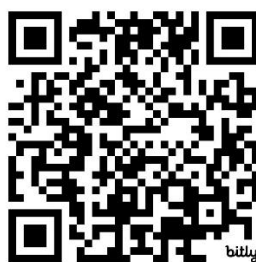
Gambar 9. QR Peta Website Desa Saliki