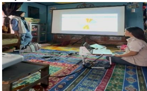
Gambar 7. Sosialisasi Pajak UMKM dan Pajak Peropangan

Pelaksanaan kegiatan sosialisasi perpajakan dan tata cara pendaftaran NPWP di Pulau Taddutan, Desa Saliki, memberikan hasil positif dengan meningkatnya pemahaman dan kesadaran masyarakat terhadap kewajiban perpajakan. Melalui penjelasan dasar perpajakan, diskusi interaktif, serta praktik pendaftaran NPWP secara online, warga memperoleh pemahaman mendalam mengenai jenis-jenis pajak, khususnya Pajak UMKM dengan PPh Final 0,5% dari omzet bruto dan pajak perorangan dengan tarif progresif sesuai UU HPP terbaru. Kegiatan ini tidak hanya memperluas wawasan, tetapi juga menumbuhkan motivasi dan rasa tanggung jawab untuk tertib administrasi perpajakan sebagai bentuk kontribusi terhadap pembangunan desa. Diskusi partisipatif mampu menjawab tantangan peserta serta meningkatkan kepercayaan diri dalam melakukan pendaftaran NPWP secara mandiri. Secara keseluruhan, keberhasilan kegiatan ini menunjukkan bahwa pendekatan edukatif berbasis praktik langsung efektif dalam membangun pemahaman, kesadaran, dan kepatuhan masyarakat, sehingga diharapkan pelaku UMKM maupun individu mampu mengelola kewajiban perpajakan secara berkelanjutan demi mendukung pembangunan ekonomi desa yang inklusif.