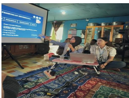
Gambar 3. Pemaparan Materi Pembukuan Sederhana

Berdasarkan hasil observasi, diketahui bahwa anggota KTH Maccini Baji Taddutan baik secara individu maupun kelompok belum terbiasa melakukan pencatatan keuangan secara sistematis, sehingga kesulitan mengetahui modal, arus kas, dan keuntungan usaha tambak mereka. Untuk mengatasi hal tersebut, dilaksanakan pelatihan pembukuan sederhana yang diawali dengan pemaparan materi mengenai definisi, tujuan, dan pentingnya pembukuan, serta pengenalan format pencatatan yang mudah digunakan. Peserta kemudian diberikan latihan pengisian format transaksi sederhana, dan meskipun awalnya mengalami kesulitan, sebagian besar mampu memahami serta mengisi dengan baik setelah mendapat arahan. Di akhir kegiatan, peserta dibekali lembar format pembukuan baru agar dapat digunakan secara pribadi dalam usaha mereka, dengan harapan dapat menumbuhkan kebiasaan pencatatan keuangan secara konsisten baik di tingkat individu maupun kelompok.