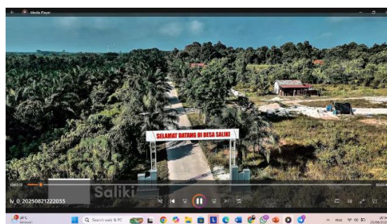
Gambar 1. Video Potensi Desa Saliki dan KTH Maccini Baji Taddutan

Berdasarkan hasil pembuatan video potensi Desa Saliki dan Kelompok Tani Hutan (KTH) Maccini Baji Taddutan, terlihat bahwa desa yang berada di Kecamatan Muara Badak, Kabupaten Kutai Kartanegara, memiliki kekayaan sumber daya alam yang melimpah di sektor pertanian, perikanan, dan pengelolaan hutan berbasis masyarakat, yang diperkuat dengan peran aktif KTH dalam menjaga kelestarian hutan, pemberdayaan hukum, serta penguatan kelembagaan organisasi. Video ini menampilkan secara utuh kehidupan masyarakat, mulai dari aktivitas sehari-hari, pemanfaatan hasil hutan, hingga upaya pelestarian lingkungan yang berpadu dengan kearifan lokal dan semangat gotong royong warga. Namun demikian, masih terdapat tantangan berupa keterbatasan akses pasar, minimnya sarana prasarana, serta kebutuhan pendampingan hukum dan manajemen organisasi agar kelompok tani dapat berkembang lebih optimal. Dokumentasi digital melalui YouTube ini diharapkan mampu memperluas pengenalan potensi Desa Saliki sekaligus menjadi daya tarik dalam mendorong pembangunan ekonomi berkelanjutan berbasis masyarakat.