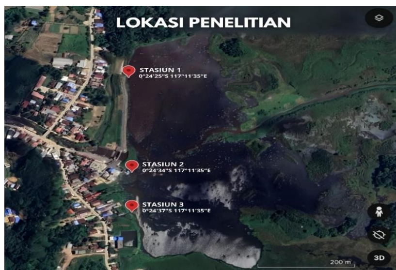
Gambar 1 Lokasi Penelitian

Penelitian ini dilaksanakan selama 4 Bulan mulai dari Bulan Oktober 2024 sampai dengan Februari 2025. Lokasi penelitian dilaksanakan di Waduk Benanga Kota Samarinda, dengan beberapa titik pengambilan sampel yang ditentukan berdasarkan aktivitas sekitar, seperti daerah pemukiman, industri, dan aktivitas lainnya. Berdasarkan peta Lokasi penelitian, waduk ini memiliki tiga titik Stasiun, diantaranya stasiun 1 (Satu) berlokasi di (koordinat 00 24' 25'' Lintang Selatan dan 117 11' 35'' Bujur Timur); stasiun 2 (Dua) berlokasi di (koordinat 00 24' 34'' Lintang Selatan dan 117 11' 35'' Bujur Timur); stasiun 3 (Tiga) berlokasi di (koordinat 00 24' 37'' Lintang Selatan dan 117 11' 35'' Bujur Timur) (Gambar 1).