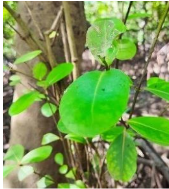
Gambar 6. Sonneratia alba

Sonneratia alba , tumbuh di daerah tanah lumpur dan berpasir, namun bisa juga di daerah batuan serta karang. Sonneratia alba tumbuh tersebar. Memiliki ketinggian yang mencapai 15 m. batangnya bewarna putih tua sampai coklat, memiliki akar nafas yang berentuknya kerucut tumpul yang tinggi akarnya dapat mencapai 25 cm. Tak hanya itu daunnya berkulit yang memiliki kelenjar yang tidak dapat berkembang di bagian pangkal daunnya, bentuk daunnya yaitu bulat telur. (Nooret al. 2012).