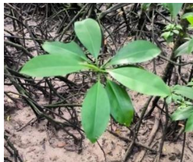
Gambar 2. Bruguiera cylindrica

Bruguiera cylindrica atau bisa disebut dengan burus, tumbuhan ini tumbuh pada tanah liat yang letaknya di belakang zona avicennia (bagian Tengah vegetasi mangrove ke arah laut). Tinggipohon Bruguiera cylindrica dapat mencapai 23 m, berakar lutut serta akar papan yang dapat melebar ke samping di bagian pangkal pohon. Daun dari Bruguiera cylindrica berwarna hijau agak kekuningan, bentuk elips dengan ujung yang meruncing (Noor et al. 2012).