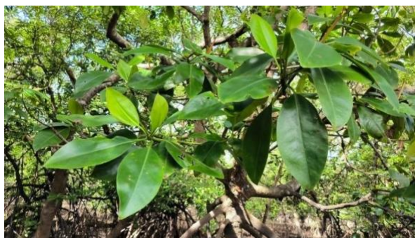
Gambar 5. Rhizophora mucronate

Rhizophora mucronata atau bisa disebut dengan bakau kurap, tinggi dari pohon ini mampumencapai 27 m, dengan diameter mampu mencapai 70 m, batangnya berwarna coklat gelap. Untuk akarnya, akar tunjang dan akar udara tumbuh dari percabangan di bagian bawah pohon. Daun Rhizophora mucronata , berbentuk eliptis yang lebar. (Noor et al. 2012)