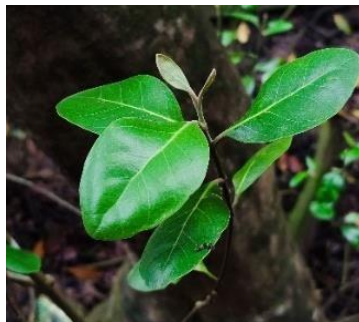
Gambar 7. Avicennia lanata

Avicennia lanata atau bisa disebut juga dengan api-api, tumbuhan ini dapat tumbuh pada substrat berlumpur, tepi Sungai serta dataran yang kering, tak hanya itu Avicennia lanata memiliki toleransi pada kadar garam yang tinggi. Pohon Avicennia lanata dapat tumbuh tinggi sampai dengan 8 m, akarnya nafas dan berbentuk seperti pensil. Untuk Daunnya memiliki kelenjar garam, pada bagian bawah daunnya bewarna putih kekuningan lalu pada bagian bawah daun memiliki rambut-rambut halus (Noor et al. 2012).