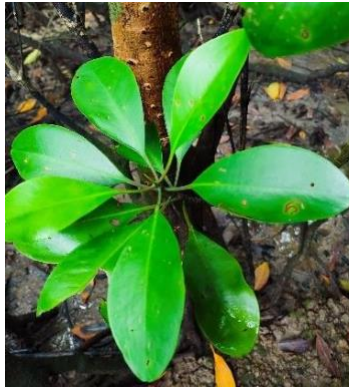
Gambar 3. Ceriops tagal