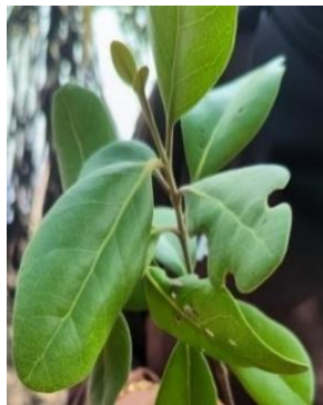
Gambar 4. Rhizophora apiculata

Rhizophora apiculata atau bisa disebut dengan bakau kacang, tumbuh di area yang tergenang, area berpasir, serta daerah yang berlumpur. (Yessa. 2012). Rhizophora apiculata biasanya memiliki batang yang berwarna kecoklatan yang pada umumnya berbentuk bulat, berpermukaan kasar, dari batang utamanya memiliki banyak cabang yang tumbuh dan dapat menjadi tegakan sendiri dan ketinggian pohon ini dapat mencapai 30 m dengan diameter mencapai 50 m. Tumbuhan ini memiliki daun yang berwarna hijau tua, lalu hijau muda di bagian Tengah dan kemerahan pada bagian bawah (Noor et al. 2012).