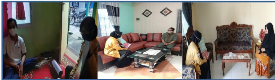
Gambar 3. Edukasi pentingnya memakai masker pada jemaah masjid menggunakan media poster secara door to door

Jika masker digunakan lebih dari delapan jam dalam satu hari dapat memicu infeksi karena masker akan lembab dan kelembapan menyebabkan terjadinya penumpukan mikroorganisme (Pratiwi, 2020). Masker medis atau masker sekali pakai yang telah digunakan dan telah dikeluarkan dari kemasan selama delapan jam juga tidak boleh digunakan kembali karena dapat memicu berbagai jenis penyakit dalam tubuh. Penggunaan masker yang terkontaminasi kuman dan digunakan lebih dari delapan jam tidak memiliki sisi filtrasi yang baik, filtrasi sendiri merupakan kegunaan utama dari masker yang bertugas menghalangi serta mengurangi debu dan polusi terhirup secara langsung oleh penggunaannya (J. T. Atmojo et al., 2020). Secara keseluruhan, berdasarkan pada pretest dan posttest yang telah dilakukan dengan memberikan 10 pernyataan yang berkaitan dengan isi poster, 8 pernyataan terbukti mengalami peningkatan pengetahuan dari posttest sebagai akhir kegiatan edukasi.