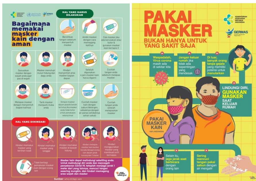
Gambar 2. Media poster yang digunakan

Beribadah Dengan Aman Melalui Sop Maco (Sosialisasi Penggunaan Masker Cegah COVID-19) Pada Jemaah Masjid Nahdatul Ulama Kelurahan Telaga Sari Balikpapan merupakan bagian dari program kegiatan PBL dengan tujuan untuk memberikan edukasi dan informasi kepada masyarakat terkait penggunaan masker yang baik dan benar yang dipasang pada area yang strategis dan sering dijangkau oleh Jemaah masjid. Adapun poster yang dipasang pada masjid wilayah RT 13 adalah poster mengenai anjuran menggunakan masker dan bagaimana penggunaan masker yang baik dan benar yang bersumber dari Kementerian Kesehatan Republik Indonesia.