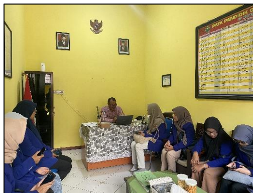
Gambar 2. Proses Perizinan kepada Kepala Sekolah SDN Kauman 02 Kota Malang

Perizinan kegiatan ini dilakukan di Sekolah SDN Kauman 02 yang dilaksanakan oleh perwakilan anggota pengabdian masyarakat. Hasil dari perizinan adalah diizinkan melakukan program kegiatan pengabdian masyarakat “GAMBIA” mengenai penyuluhan kesehatan gigi dan mulut usia sekolah. Izin dilakukan dengan melalui kepala sekolah SDN Kauman 2. Perizinan kepada pihak terkait memiliki tujuan sebagai legalitas dari suatu kegiatan pengabdian (Kusuma & Bima, 2023)