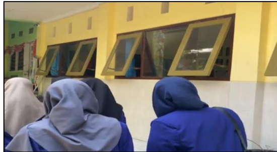
Gambar 3. Observasi dan Survei Lokasi di SDN Kauman 02 Kota Malang

gigi dan mulut pada anak, sehingga dari hasil observasi tersebut disusunlah sebuah konsep kegiatan terkait Kesehatan gigi dan mulut pada anak untuk siswa-siswi kelas 3 SDN Kauman 02 Kota Malang.