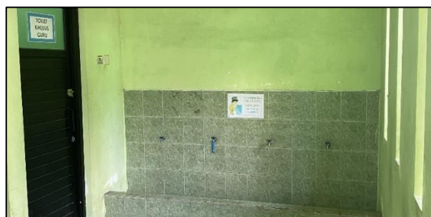
Gambar 4. Kondisi Sumber Air di SDN Kauman 02 Kota Malang