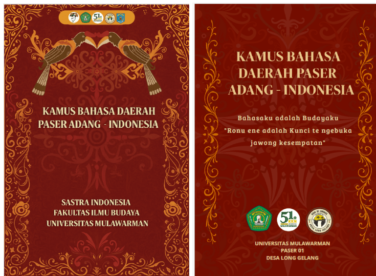
Gambar 3. Kamus Bahasa Daerah Paser Adang-Indonesia

Pelaksanaan pembelajaran bahasa daerah Paser masih terbatas melalui pendekatan pendidikan dan pelatihan sekolah. Jika dibandingkan dengan di daerah lain seperti pendekatan pembelajaran bahasa Barru (Bugis) melalui teknologi dan workshop pembelajaran (Rengko et al., 2025). Demikian pula, pembelajaran bahasa daerah Maluku Tengah (Tulehu) melalui pendekatan kolaborasi komunitas-sekolah (Arivina da Costa et al., 2021). Selain itu masih terbatasnya publikasi ilmiah terkait upaya pelestarian bahasa daerah Paser.