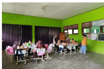
Gambar 2. Pembelajaran Bahasa Paser

Setelah serangkaian kegiatan pengajaran, evaluasi dilakukan untuk mengukur pemahaman siswa terhadap Bahasa Paser Adang. Hasil evaluasi menunjukkan peningkatan minat dan kemampuan siswa dalam menggunakan bahasa daerah, serta kesadaran mereka akan pentingnya melestarikan budaya lokal. Kegiatan ini berdampak positif secara langsung bagi para siswa, dan mendorong masyarakat untuk lebih menghormati dan menjaga Bahasa Paser Adang sebagai bagian penting dari jati diri mereka.