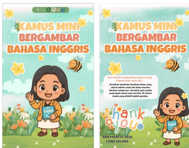
Gambar 5. Kamus Mini Bergambar Bahasa Inggris

Pelaksana kegiatan pengabdian kepada masyarakat juga membuat kamus mini bergambar Bahasa Inggris yang berisikan kosakata dengan disertai gambar-gambar yang menarik (Gambar 5). Buku kamus bahasa Inggris ini menjadi media pembelajaran yang bisa dimanfaatkan oleh guru dan siswa dalam proses pembelajaran.