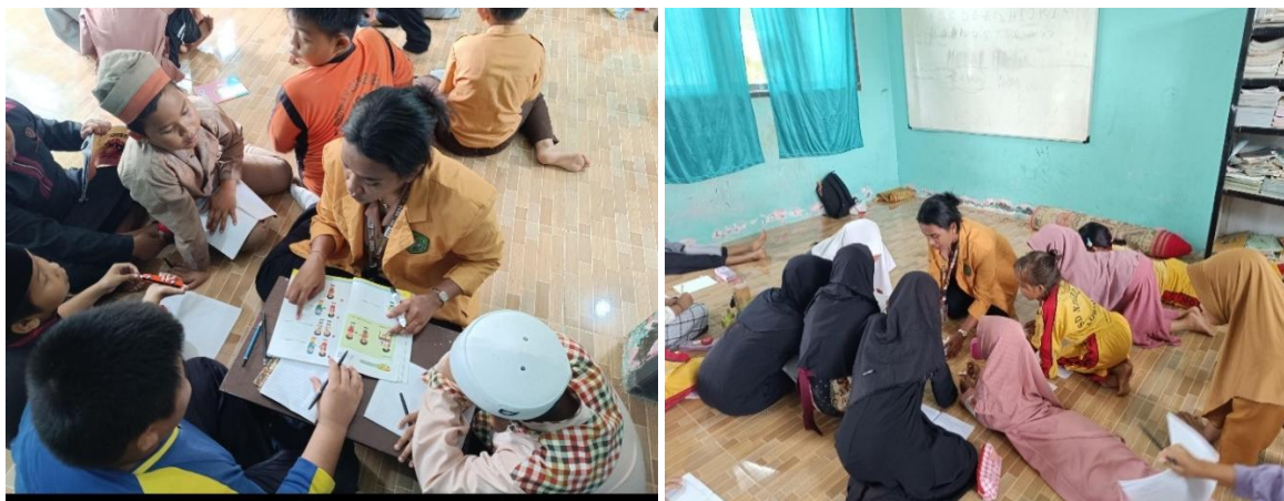
Gambar 4. Pembelajaran Bahasa Inggris

Program pengabdian kepada masyarakat di Desa Long Gelang melalui kegiatan mengajar Bahasa Inggris di SDN 008 Desa Long Gelang menjadi salah satu upaya peningkatan kualitas pendidikan dasar. Kegiatan ini lahir dari kesadaran bahwa penguasaan Bahasa Inggris sejak dini menjadi bekal penting bagi generasi muda untuk menghadapi perkembangan ilmu pengetahuan dan teknologi di masa depan. Pembelajaran bahasa Inggris di tingkat sekolah menengah berbeda dengan di sekolah dasar. Namun, apabila anak-anak di sekolah dasar memperoleh pembelajaran bahasa Inggris yang sesuai dengan karakter dan tingkat perkembangan mereka, maka ketika melanjutkan ke jenjang menengah, mereka tidak akan mudah mengalami tekanan psikologis dan perkembangan kognitif mereka akan tetap terjaga dengan baik (Maili, 2018). Berdasarkan kondisi ini, mahasiswa hadir sebagai fasilitator pembelajaran yang memberikan materi dan menghadirkan metode belajar yang kreatif, interaktif, dan menyenangkan sehingga siswa dapat lebih mudah memahami serta termotivasi untuk belajar Bahasa Inggris.