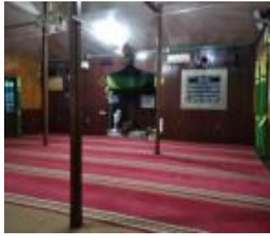
Gambar 10. Pola Ruang Langgar Al Washilah