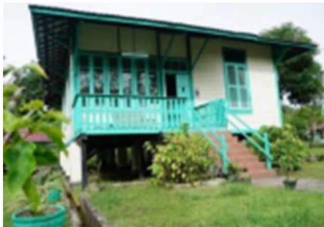
Gambar 9. Rumah Dahor Balikpapan