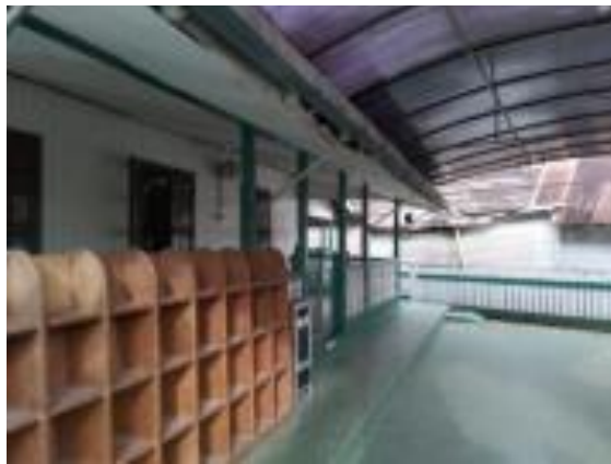
Gambar 14. Teras Langgar Al Washilah

Dari bagian samping kanan bangunan, terdapat tempat wudhu wanita dan pria yang bisa langsung diakses melalui area depan bangunan. Selanjutnya ada tempat mengaji yang diperuntukkan pada anak-anak di daerah sekitar langgar. Tempat mengaji ini merupakan salah satu penambahan untuk menambah fungsi dari bangunan. Masuk ke area beribadah, di dalamnya disediakan beberapa fasilitas yang bisa digunakan oleh jamaah diantaranya ada AC ditambah lagi dengan beberapa kipas angin, lampu gantung yang berada di tengah-tengah ruang beribadah, lukisan kaligrafi yang selalu ada di tempat ibadah umat muslim pada umumnya, selain itu ada juga lemari kaca yang didalamnya disediakan beberapa alat sholat dan juga Al-Quran untuk dipinjam oleh jamaah, lalu ada ambal tentunya untuk alas sholat, ada juga gorden pemisah antara jamaah laki-laki dan jamaah perempuan, dan terakhir ada jam pendulum yang secara tidak langsung menjelaskan bahwa langgar ini sudah berusia tua.