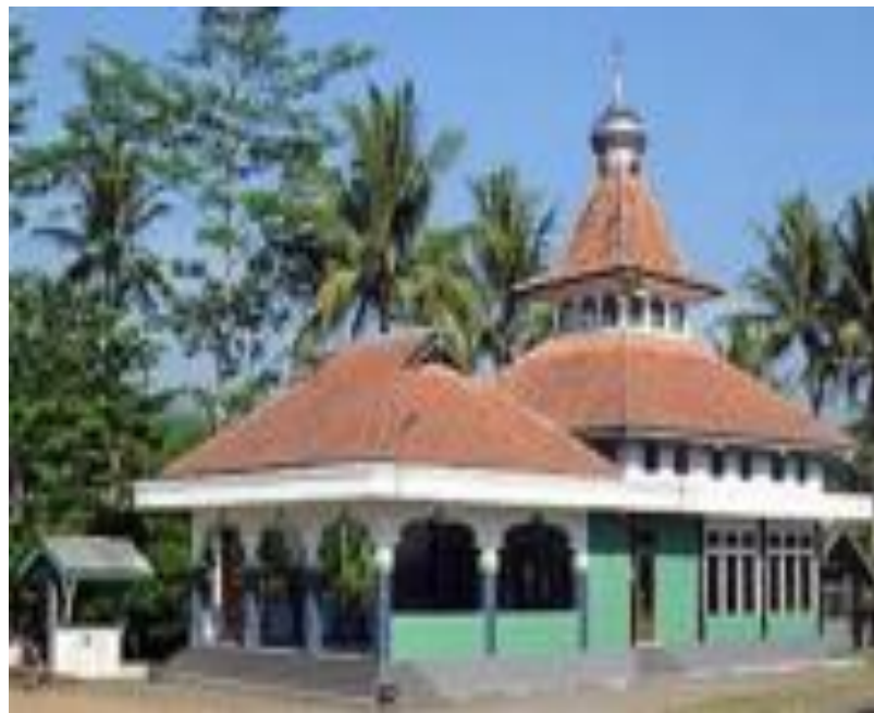
Gambar 7. Dinding Masjid di Indonesia

Di sekeliling teras bangunan langgar terdapat pagar kecil yang mengadopsi gaya Belanda dengan material kayu. Warna yang digunakan masih sama seperti warna dinding pada bangunan. Pagar seperti ini juga bisa ditemukan pada Rumah Dahor yang ada di Balikpapan.