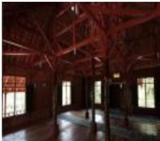
Gambar 13. Masjid Kayu Tuatunu Palangkaraya