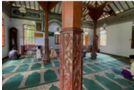
Gambar 11. Masjid Hidayatullah Jakarta