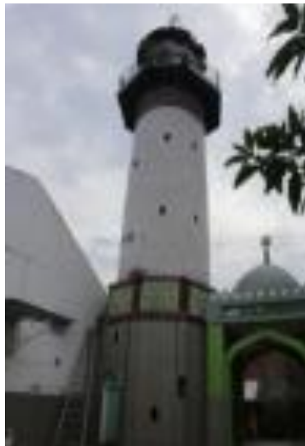
Gambar 5. Masjid Layur Semarang

Dinding langgar bermaterial kayu yang didominasi oleh warna hijau dan putih. Di dalam Islam kedua warna tersebut melambangkan kebaikan. Warna hijau dan putih juga diterapkan pada kebanyakan masjid yang ada di Indonesia sehingga menjadi ciri khas hingga sekarang.