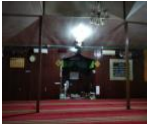
Gambar 12. Kayu Ulin Langgar Al Washilah