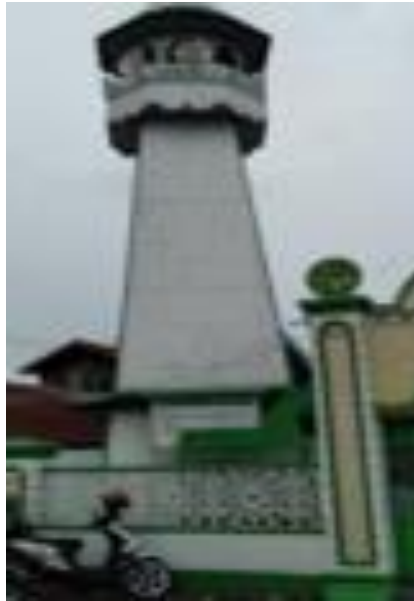
Gambar 4. Minaret Langgar Al Washilah