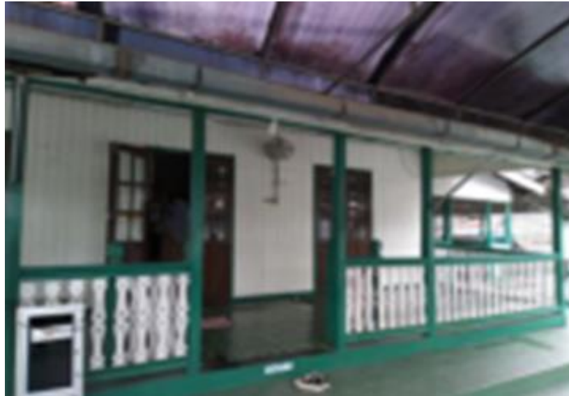
Gambar 6. Dinding Langgar Al Washilah