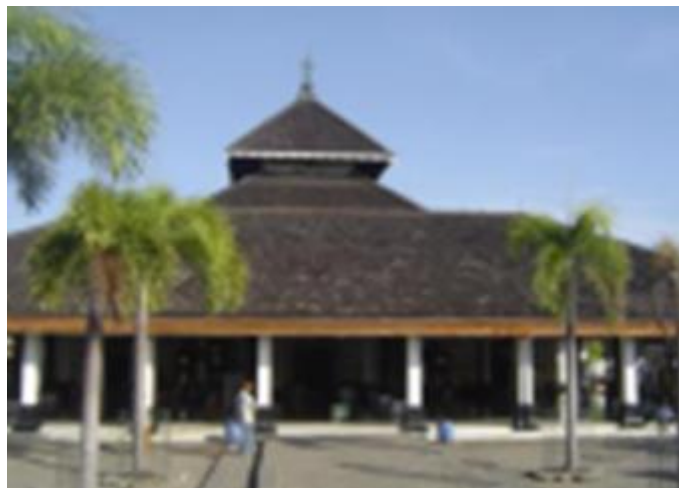
Gambar 3. Masjid Agung Demak

Selanjutnya, terdapat sebuah minaret pada langgar Al Washilah ini yang bermaterial kayu dengan penutup atap sama seperti pada bangunan utama yaitu atap kayu sirap. Berbeda dari minaret biasanya yang berbentuk lingkaran, minaret langgar Al Washilah berbentuk persegi yang semakin ke atas diagonal minaret semakin kecil. Minaret dengan bentuk serupa dapat ditemukan pada Masjid Layur, Semarang.