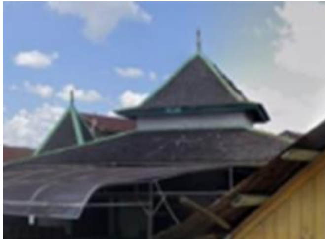
Gambar 2. Atap Langgar Al Washilah

Atap pada langgar Al Washilah berbentuk limasan yang terdiri dari dua susun. Atap dua susun ini melambangkan dua kalimat syahadat yang diyakini oleh umat Islam sebagai tanda kepercayaan kepada Allah SWT. Material yang digunakan pada bagian penutup atap langgar adalah atap sirap kayu. Atap seperti ini banyak ditemui pada tempat beribadah kuno yang ada di Indonesia seperti pada Masjid Agung Demak.