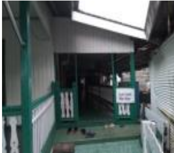
Gambar 8. Pagar Langgar Al-Washilah