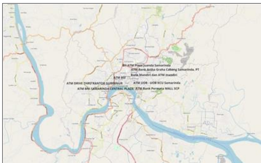
Gambar 2. Hasil Implementasi Menggunakan QGIS

Ini meningkatkan pemahaman tentang aksesibilitas dan kemungkinan penambahan ATM di wilayah tertentu. Anda dapat mengekspor hasil peta yang telah diolah ini dalam bentuk PDF atau gambar untuk digunakan dalam laporan atau presentasi, membantu analisis dan pengambilan keputusan berbasis data menjadi lebih efisien. Dengan kata lain, penggunaan data ATM di QGIS memungkinkan visualisasi dan analisis distribusi ATM yang informatif dan bermanfaat untuk perencanaan dan evaluasi.