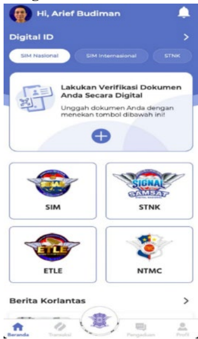
Gambar 2. Layanan SINAR pada aplikasi Digital Korlantas POLRI

Dengan SINAR, POLRESTA Samarinda berkomitmen meningkatkan kepercayaan masyarakat terhadap layanan perpanjangan SIM melalui aplikasi digital yang cepat dan efisien, mengikuti perkembangan teknologi serta mengurangi keluhan terhadap pelayanan yang ada. Adapun biaya perpanjangan SIM yang dibebankan kepada pemohon diluar tarif tes psikologi dan kesehatan pada tabel 1. sebagai berikut: