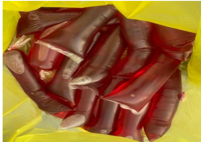
Gambar 3. Bungkusn Plastik Cairan Sumba Merah yang digunakan

dilakukan pencatatan. Pengamatan dilakukan selama 2 minggu pada satu lokasi.