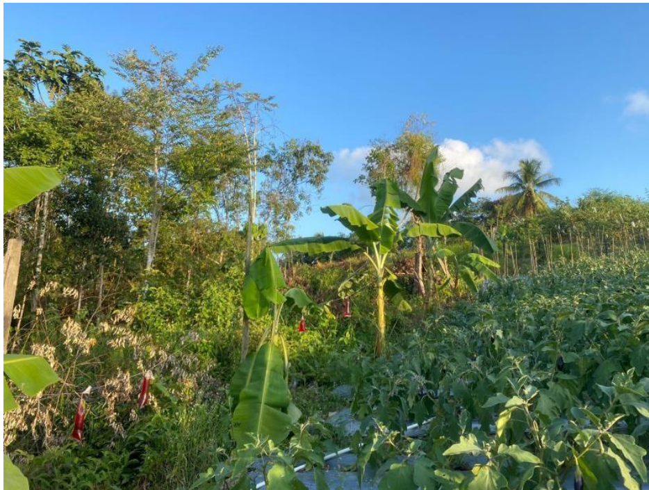
Gambar 2. Lokasi Kegiatan di Perkebunan Rakyat dengan Perlakuan Gantungan Sumba Merah

Bagian pohon yang dimakan berupa buah, daun dan bunga. Beberapa jenis tanaman yang disebutkan tersedia dan dapat ditemukan di beberapa kebun warga, seperti terlihat pada Gambar 2.