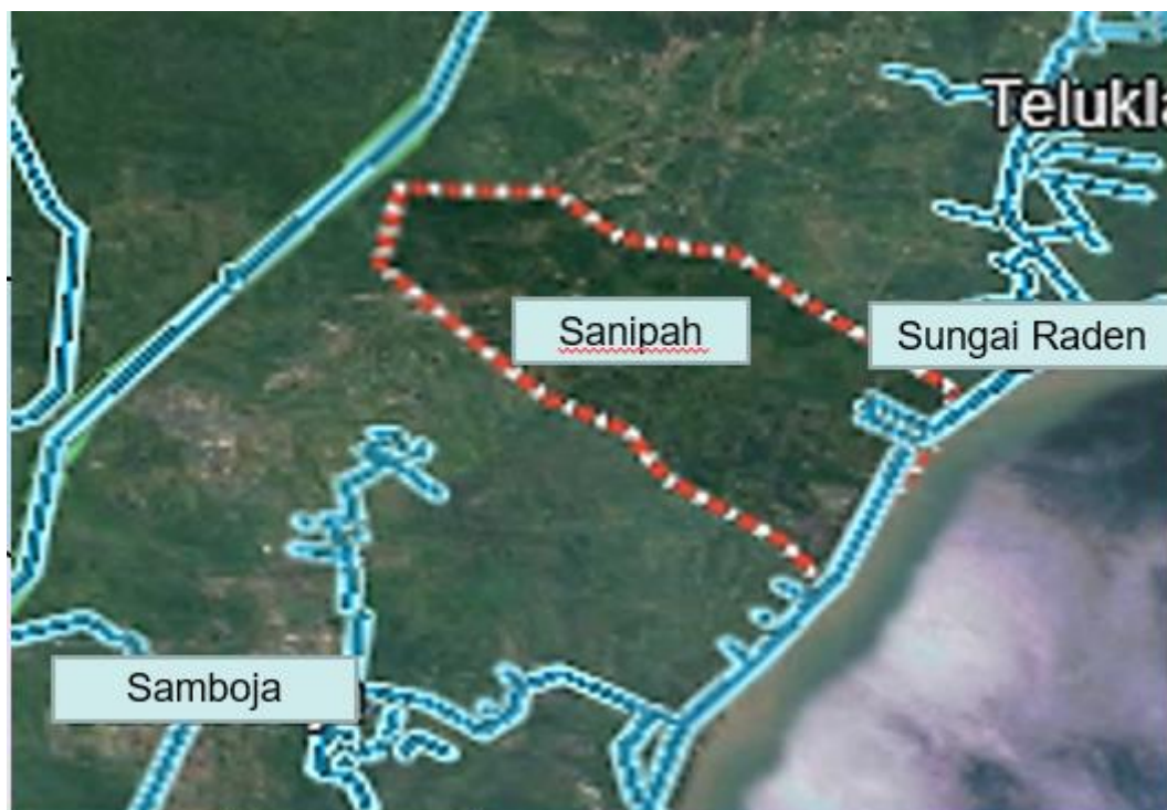
Gambar 1. Lokasi Kelurahan Sanipah

Kelurahan Sanipah terletak di Kecamatan Samboja Kabupaten Kutai Kartanegara dengan luas wilayah 117 km 2 . Desa Sanipah terdiri atas 15 Rukun Tetangga dengan jumlah penduduk 4.502 jiwa yang bermukim sepanjang jalan Balikpapan – Handil. Kelurahan Sanipah memiliki banyak lahan tidur yang saat ini mulai dikembangkan perkebunan karet dan sawit dan diperkirakan akan menjadi satu komoditi perkebunan yang berkembang di masyarakat (Kutai Kartanegara dalam Angka 2019).